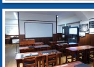
学校教育歴史ビデオ