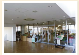
奈良市北部図書館(4階)