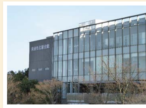
奈良市北部会館(高の原駅前)

一般質問した内容が実現することになりました。 奈良市との公共施設の相互利用がスタートします。 今年10月から、奈良市北部図書館(奈良市北部会館4階)の本の貸し出しが可能となる予定。是非、ご活用ください。